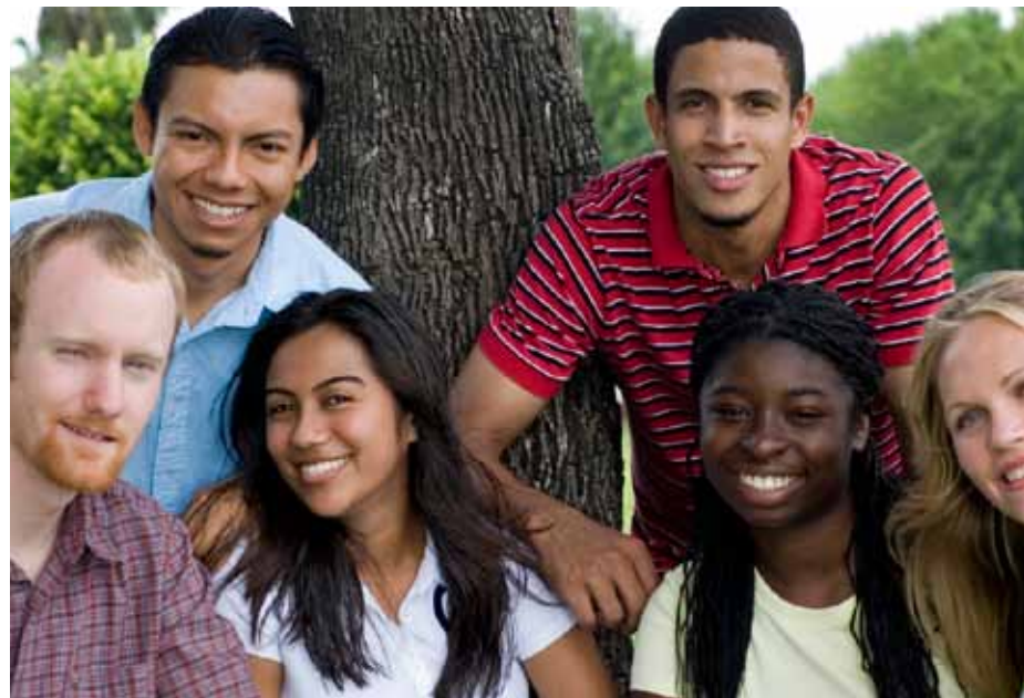
Volorest, sitatur aliquos nos explaut parum vel illenihillor secte experum qui autempelique offic tenit velibus il maio blaceatia earis ium duciat, quo omnihitio. Itaerum est, sit inciet quatestibust volupta eatem qui ut

Venem iditem et re pa et del ea volurrunqui nimpos eosto cust eum ium esed es ma cum idipisvelissed que sitaeria volorem rem ni tecusam fugias dolupta sandi blatis eatio. Vit et quunt et ese officiis maio venim es re officipsam arum ut essit ullaute mporia ute imodit fuga. Nos nonsequi ut imus.