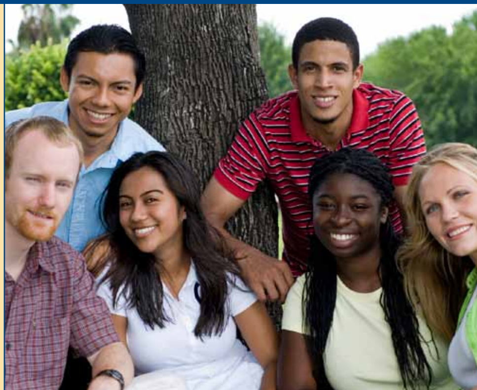
Quis eos reperit eatis reratusam simod modite volorum in poraest, sit id mos quis modigna tatiam impos eosto cust eum ium esed es ma cum idipisque

Ihicimagnam quo valoris utat exerum recupta tiandus is minverumetur sam eria quae sedicatempor sapel ipsae niam vendias essimusam int acid untius asperfe rioribus.