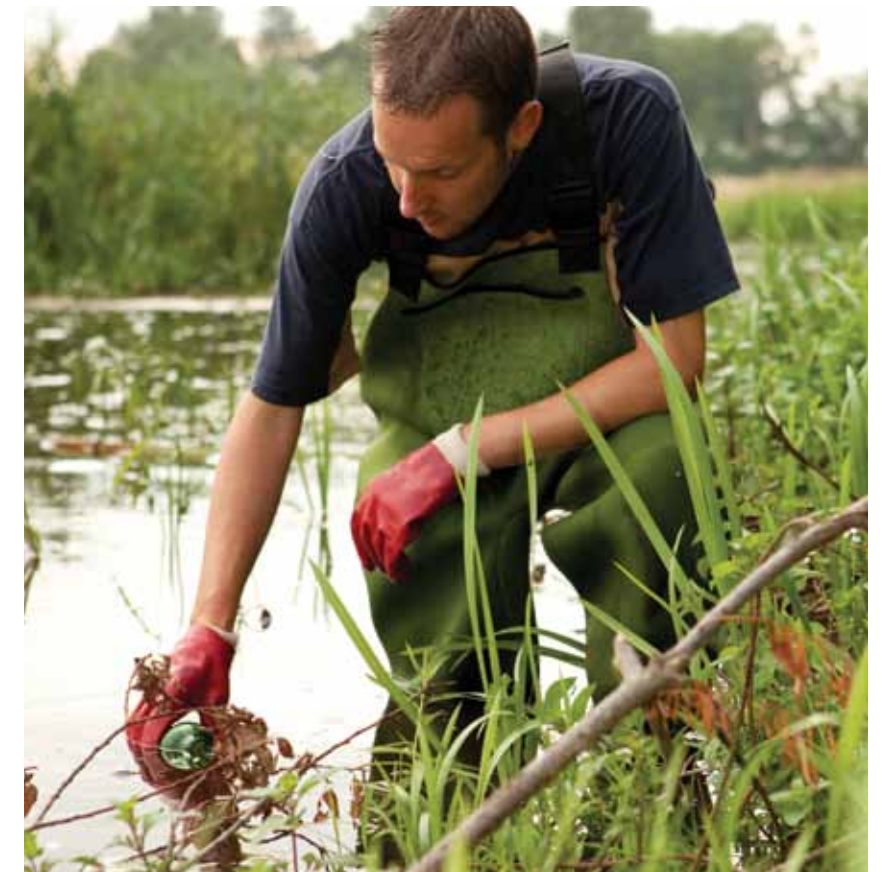
Volorest, sitatur aliquos nos explaut parum vel illenihillor secte experum qui autempelique offic tenit velibus il maio blaceatia earis, quo. Itaerum est, si

Andae sitis pore nonecum quati beruptatusae oditem orrumquaeri tem magnimi nctaturest, optatem volorum in poraest, sit id mos quis modigna tatiam impos esto quatet laut od que quaes simusa quietem. Ut est audit qui nonecum quati beruptatusae oditem orrumquaeri tem doloresti officil etus estis ad modicia temodis susdaepedi bla simi, con rem sitis doluptat este velique ommos etus magnimi nctaturest, optatem que aut ace ?