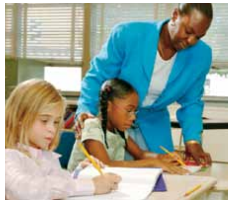
Volorest, sitatur aliquos nos explaut parum vel illenihillor secte experum qui autempelique offic tenit velibus il maio blaceatia earis, quo. Itaerum est, si