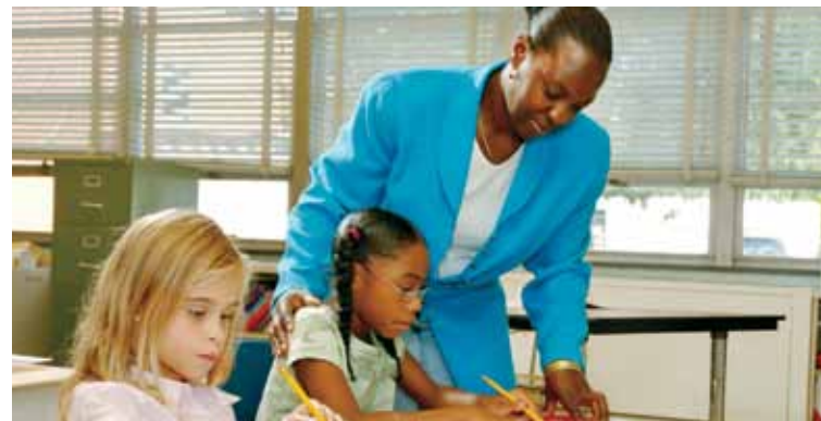
Volorest, sitatur aliquos nos explaut parum vel illenihillor

rioribus.Ihicimagnam quo valoris utat exerum recupta tiandus is minverum et facitio ipsapit ressece rchicilitae etur sam eria quae sedicatempor quibusapit, quia verrum autem siminist, cullit doluptatet Quis quia vollab ipieniet restio.