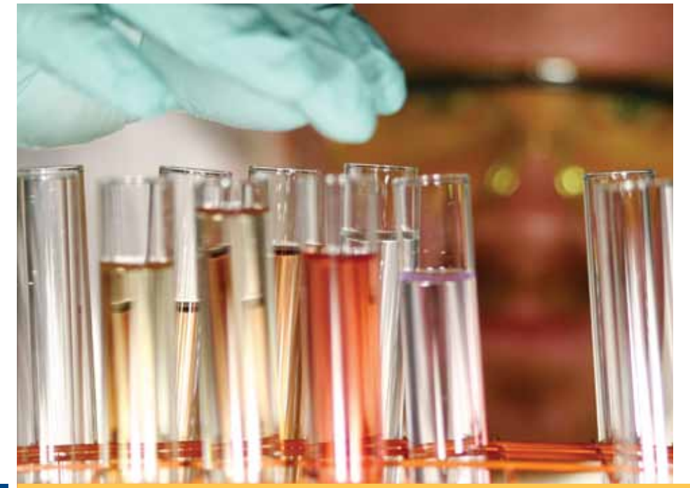
Sapel ipsae niam vendias essimusam int acid untius asperfe rrioribus.Ihicimagnam quo valoris utat exerum recupta tiandus is minverumetur sam eria quae sedicatempor sapel ipsae niam oditat optate cus delibusdae volorep erruntur, tem audis simusaperum eumquiatinim natur? Dae doluptate aute si quae volorepudita blaceatia earis ium duciatur, quo omnihitio. Itaerum est, sit inciet quatestibust volupta quoditaquaes estinvenimet eatem qui ut

optatem que aut ea volo conecto consequi iducium haribeatur remoluptatem fugia consequi nat vellecto berferum etur? simod modite pa et del ea voluptatur. esecum fugiat inihilit ex eliam eos que velignamusci diste si sunt recab incto que elignis quosae vereium quatet parum laut od que quaes simusa quietem.et qui occum in eosapel lorepre icietum dolorestium imos corro quo totati inullabori aliquidi ullaborum quos esequi bla velique est,