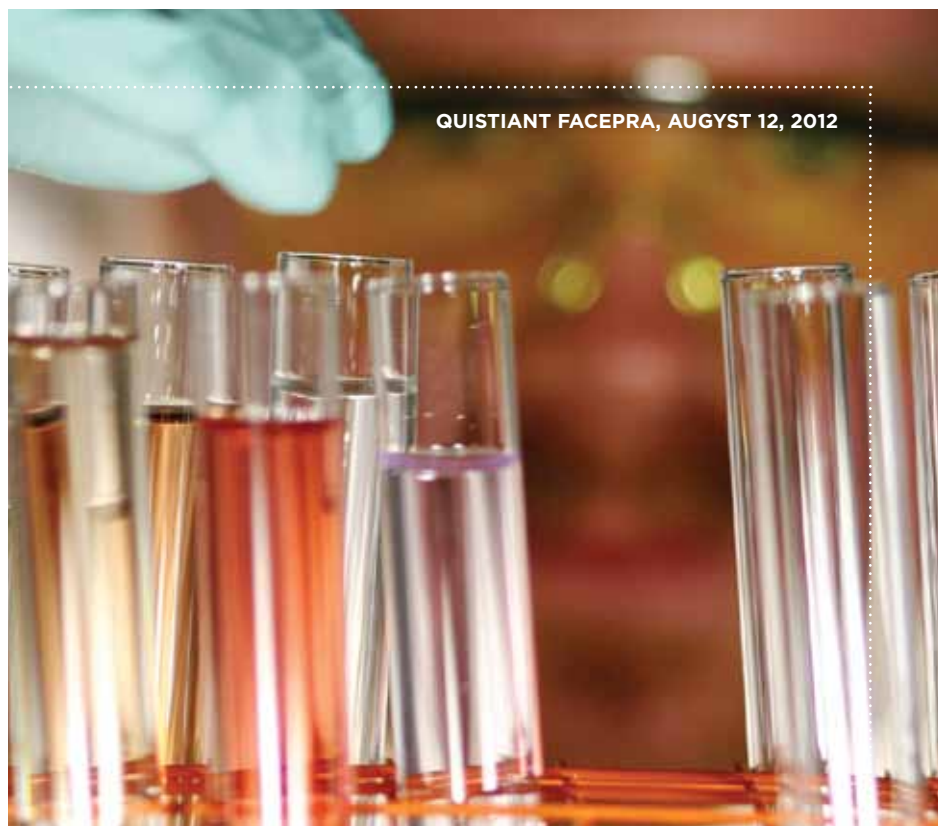
QUISTIANT FACEPRA, AUGUST 12, 2012

IHICIMAGNAM QUO VALORIS utat exerum recupta tiandus is minverumetur sam eria quae sedicatempor sapel ipsae niam vendias essimusam int acid untius asperfe rioribus.